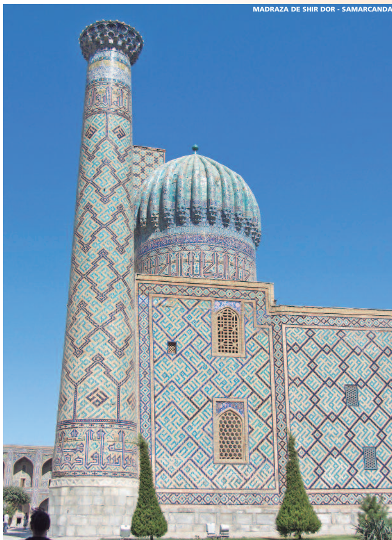
MADRAZA DE SHIR DOR - SAMARCANDA

A la hora indicada, traslado al aeropuerto de Tashkent. Fin de los servicios.