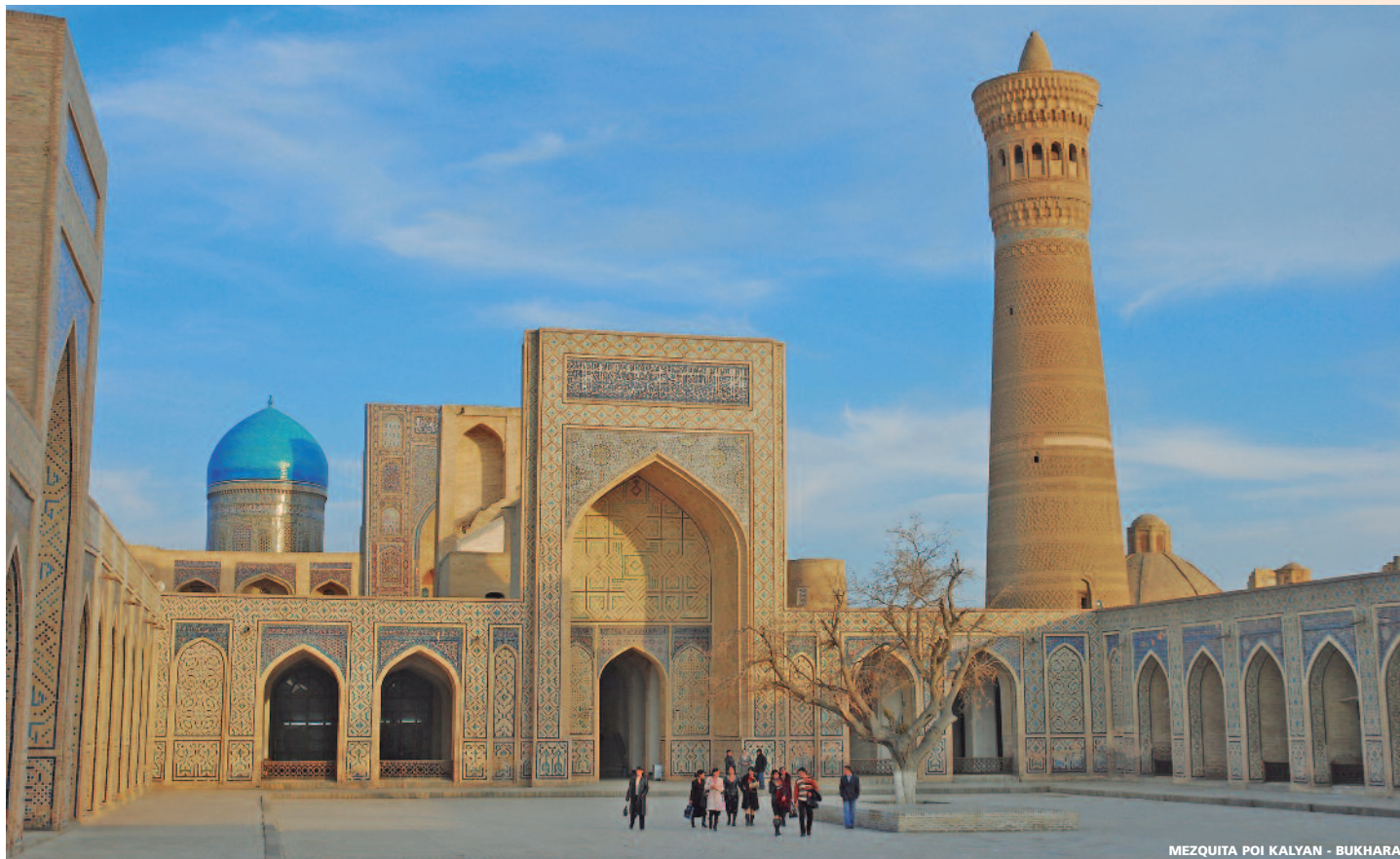
MEZQUITA POI KALYAN - BUKHARA

7 días (6 noches de hotel) desde 1.015 USD