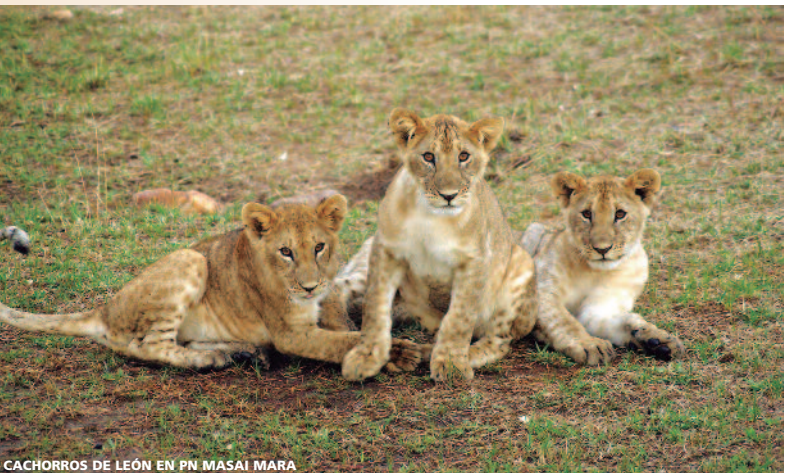
CACHORROS DE LEÓN EN PN MASAI MARA

- Está prohibido introducir bolsas de plástico en Kenia desde finales del 2017. Por favor, nos solicite información adicional pues su equipaje será controlado y cualquier material plástico requisado.