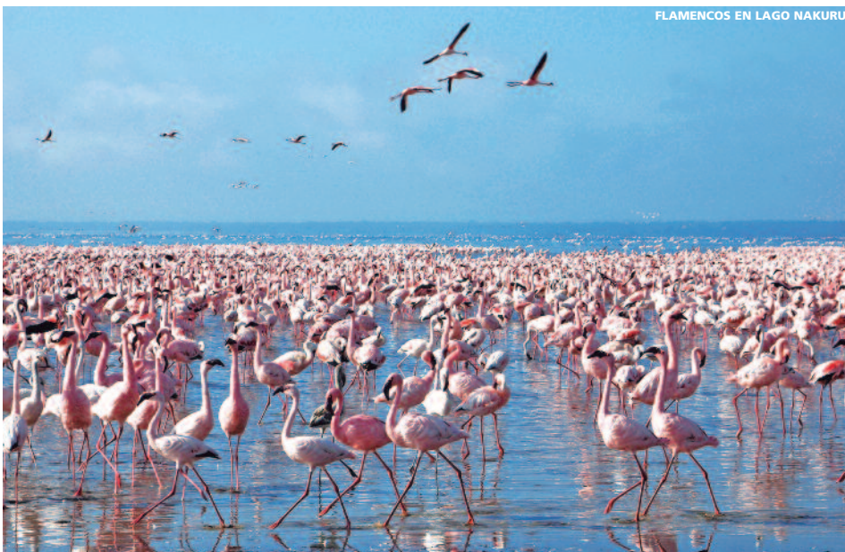
FLAMENCOS EN LAGO NAKURU

• 8 días / 7 noches + 7 desayunos + 5 almuerzos + 6 cenas (sin bebidas).